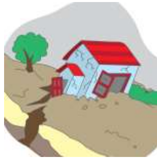
地震( ✓ )