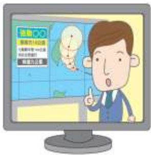
注意颱風資訊( ✓ )