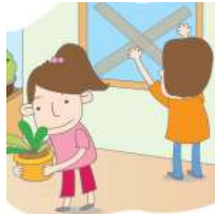
加固門窗( ✓ )