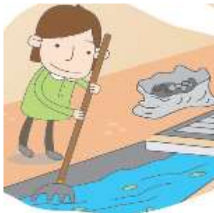
暢通水溝( ✓ )