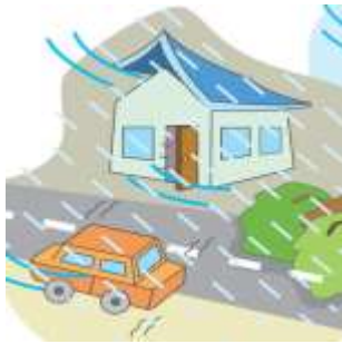
颱風( ✓ )