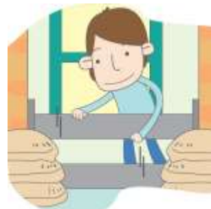
沙包或防水閘門( ✓ )