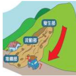
土石流( ✓ )