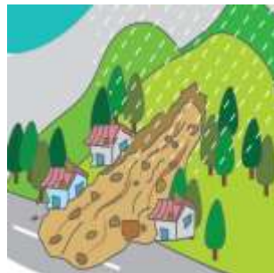
疏散撤離準備( ✓ )