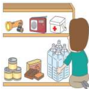
準備防災物資( ✓ )