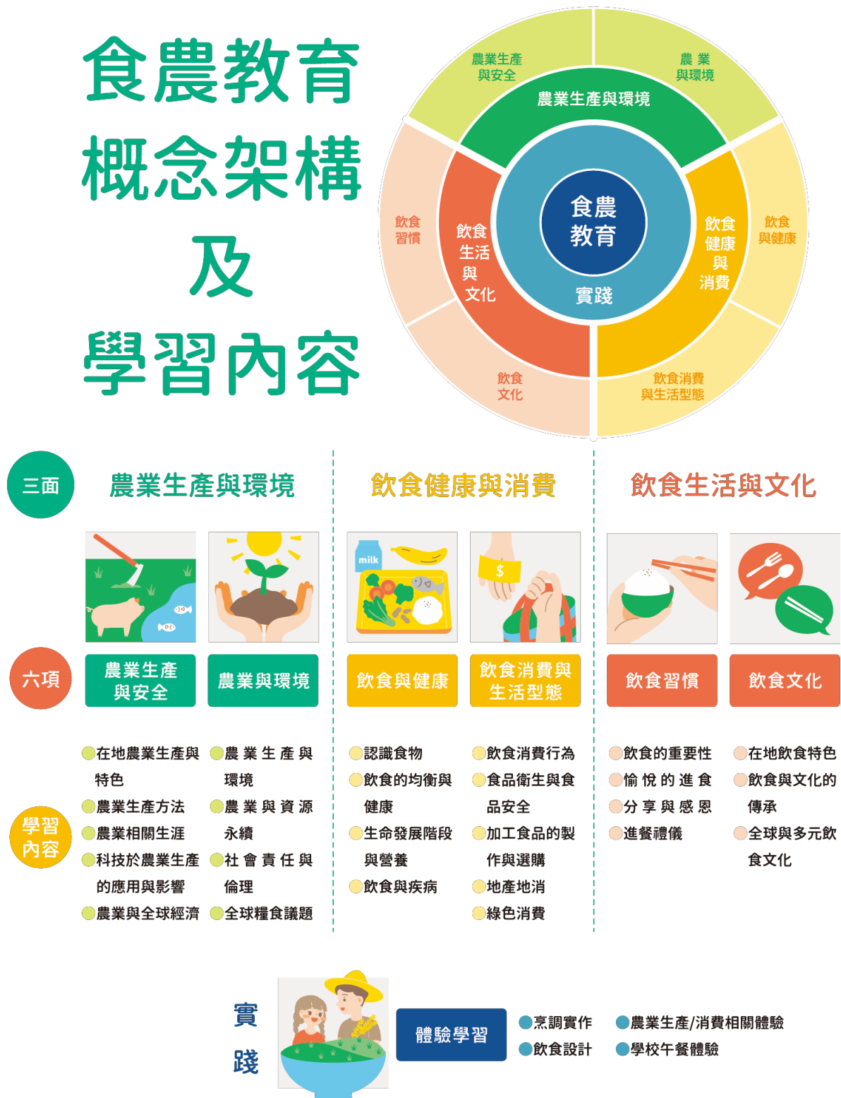
圖 1 食農教育 ABC 模式：食農教育三面六項

資料來源：林如萍，食農教育之推展策略（一）：學校教育實施之概念架構分析，106 年度國立臺灣師範大學產學合作計畫研究報告，頁 28。