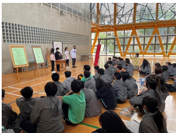
跨校科展複審區-國小組學生進行口頭報告