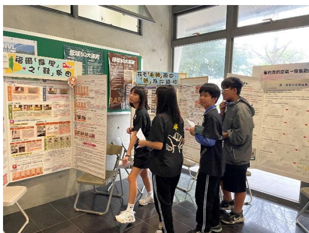
科普素養-閱讀歷屆國展作品報告