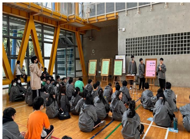
跨校科展複審區-國中組學生進行口頭報告