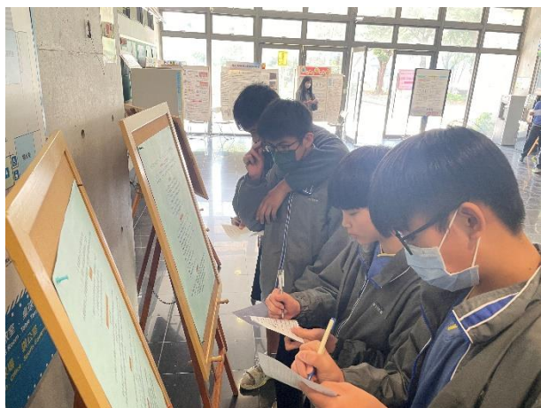
科學閱讀區-學生認真閱讀完成學習單